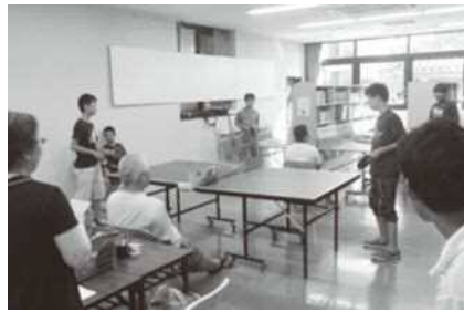
「シャローム卓球大会」(長府東公民館)

赤い羽根共同募金は、市内で活動するボランティアグループの活動資金として、福祉や児童福祉、子育て支援のために活用されています。関する取組など、地域を住みやすくするために、さまざまな自主的、主体的な活動を支援するため、活用されています。