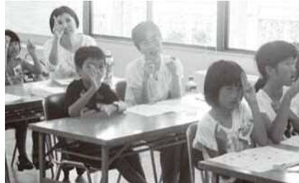
「夏休み親子手話講習」(下関市社 福祉センター)