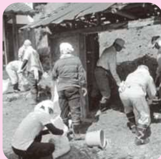
災害ボランティア活動支援 (H25 秋ノ豪雨災害)