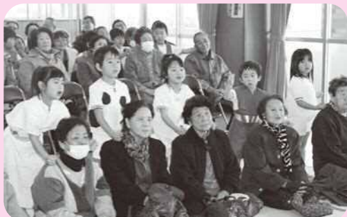
地区社協主催 「高齢者と保育園児のふれあい昼食会」 (豊北町角島地区社協)